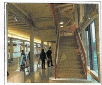
新庁舎待合ロビー